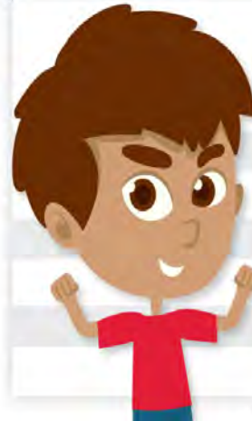
Tabla de Ingresos