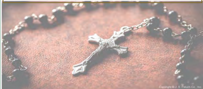
Copyright © J. S. Paluch Co., Inc.

Remember, O most gracious Virgin Mary, that never was it known that anyone who fled to thy protection, implored thy help, or sought thy intercession, was left unaided. Inspired by this confidence I fly unto thee, O Virgin of virgins, my Mother. To thee do I come, before thee I stand, sinful and sorrowful. O Mother of the Word Incarnate, despise not my petitions, but in thy mercy hear and answer me. Amen.