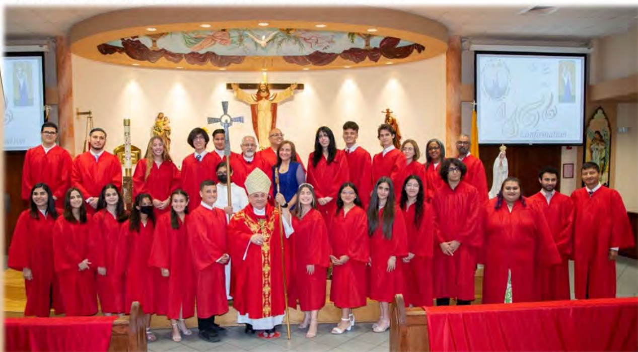
Tuesday May 10, 2022: The Sacrament of Confirmation was celebrated by Bishop Enrique Delgado, to 11 teens from our Religious Education Program, 9 adults from our RCIA/RICA program and 6 adults from our sister Church, Our Lady of Guadalupe.